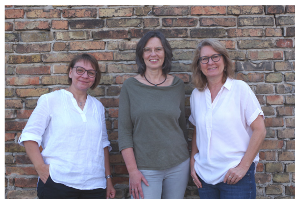
Das Team der Beratungsstelle in Lippstadt